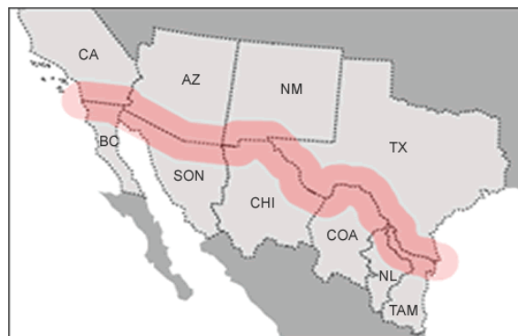
Mapa 2. Franja que delimita la “Zona Fronteriza” legal entre México y EE.UU

El Acuerdo de La Paz faculta a las autoridades ambientales federales en México y en EE.UU para llevar a cabo iniciativas de cooperación y se